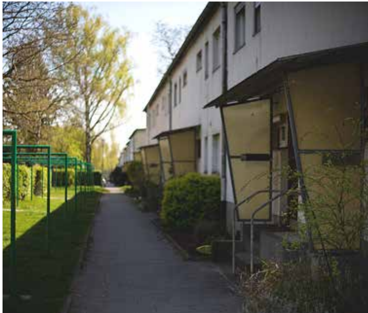
Typische Häuserzeile in der May-Siedlung.

schaftlich und gerecht sein. Während die Bewohner von Frankfurter Altbauwohnungen für ein Bad noch in die „Volksbrausebäder“ gehen mussten, hatten die Westhausener bereits moderne Bäder in ihren Wohnungen. Dazu wurden auch